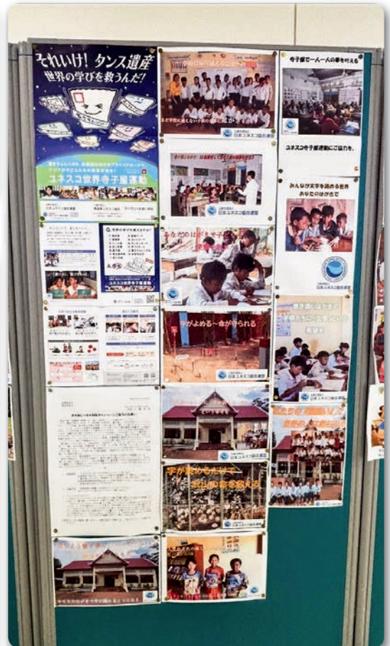
小和森小学校 書きそんじハガキ協力掲示