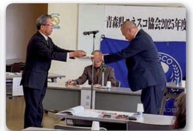
書きそんじハガキ 感謝状授与