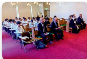
青森市ご来賓(手前2名)