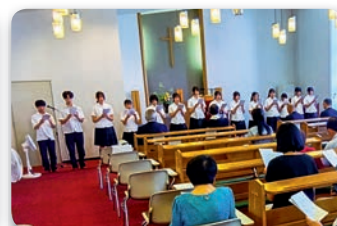
「唱歌 ふるさと」 青森明の星中学・高等学校音楽部