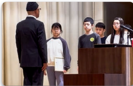
平川市立小和森小学校 書きそんじハガキ引渡