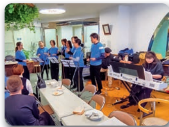
ゴスペルクワイヤー Sound of joy